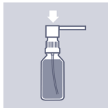
Nun Pumpkopf auf den freiliegenden Teil der Pumpvorrichtung aufsetzen und festdrücken. Vorsicht: Nicht verkanten!