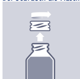
Schraubkappenverschluss aufschrauben, Flasche öffnen.

Bei Gebrauch die Flasche senkrecht halten.