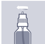
Flasche wieder fest verschließen.