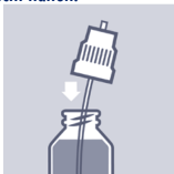
Pumpvorrichtung in die Flasche einführen.